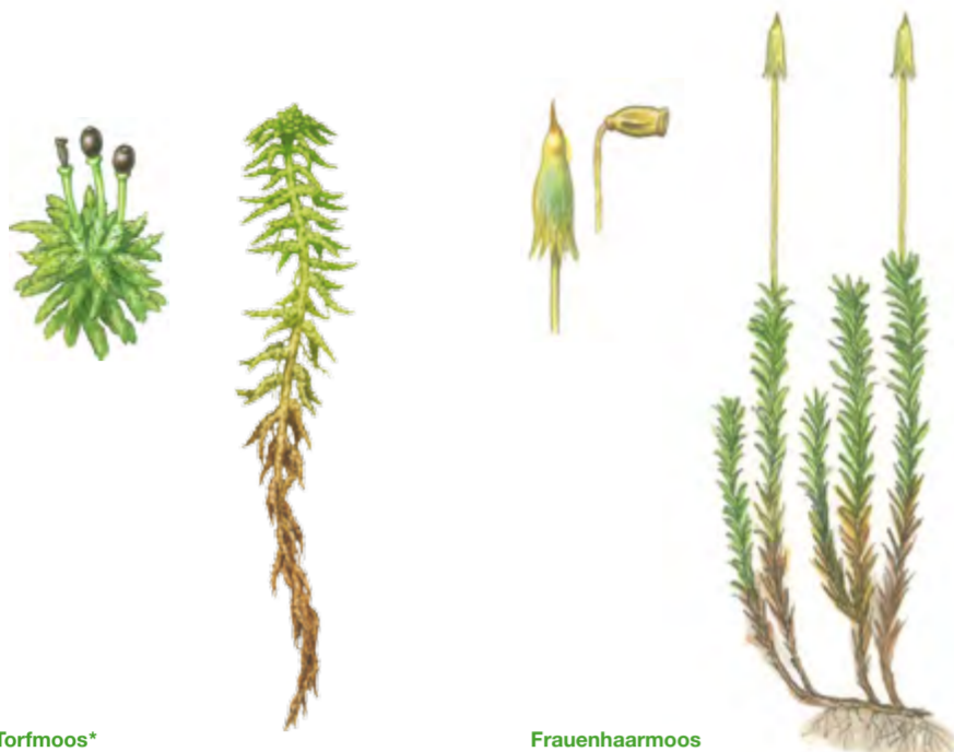
Torfmoos* Sphagnum 5 – 20 cm | Juli – September (Sporen reifen)