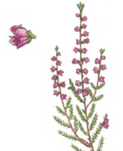
Besenheide Calluna vulgaris 30 – 100 cm | August – Oktober