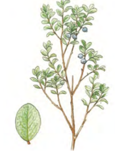
Rauschbeere Vaccinium uliginosum 30 – 100 cm | Mai – Juli