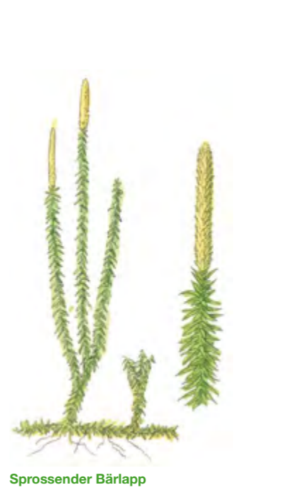
Sprossender Bärlapp Lycopodium annotinum 10 – 30 cm | August – September (Sporen reifen)