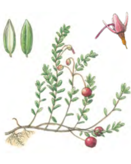
Gewöhnliche Moosbeere Vaccinium oxycoccos 2 – 6 cm | Mai – August