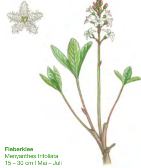
Fieberklee Menyanthes trifoliata 15 – 30 cm | Mai – Juli