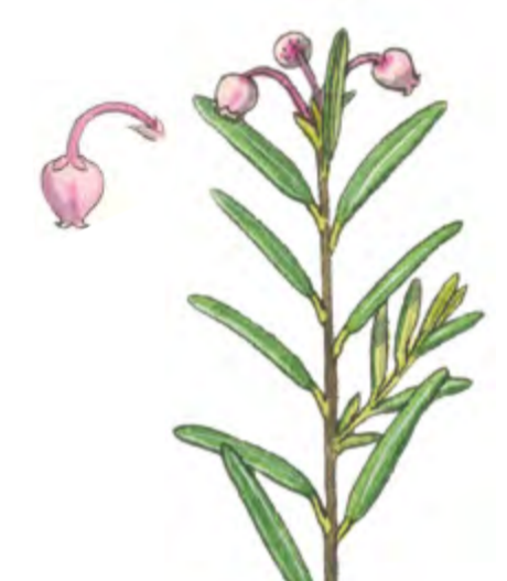
Rosmarinheide Andromeda polifolia 15 – 30 cm | Mai – August