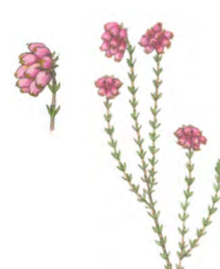
Glockenheide Erica tetralix 15 – 50 cm | Juni – September