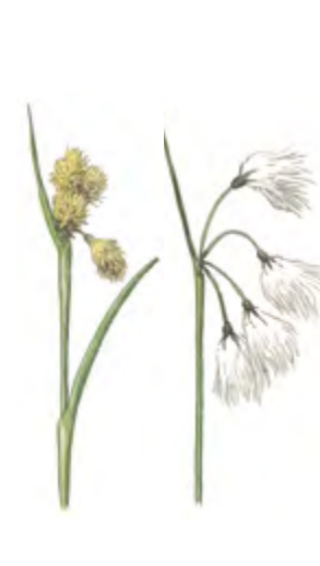
Schmalblättriges Wollgras Eriophorum angustifolium 20 – 90 cm | März – Mai