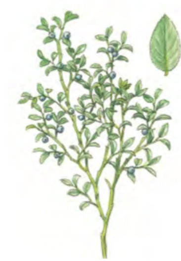
Heidelbeere Vaccinium myrtillus 15 – 50 cm | April – Juni