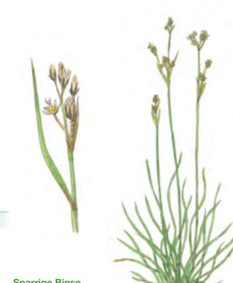
Sparrige Binse Juncus squarrosus 10 – 35 cm | Juni – August