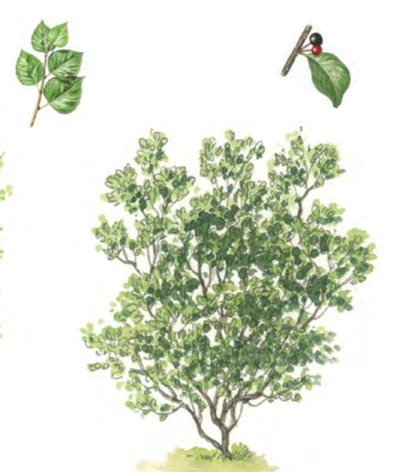
Faulbaum Frangula alnus 1 – 4 m | Mai – Juni