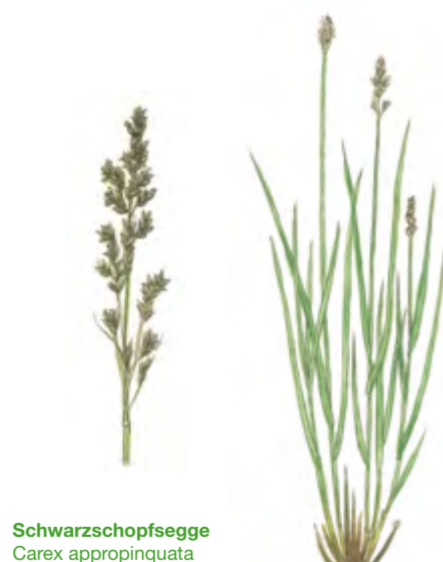
Schwarzschofsegge Carex appropinquata 70 – 110 cm | Mai – Juni