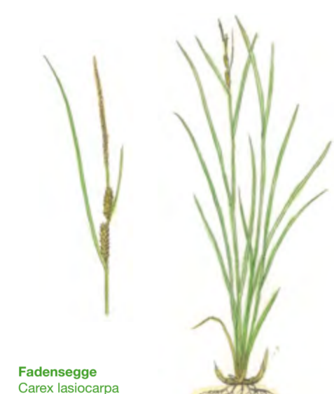
Fadensegge Carex lasiocarpa 30 – 100 cm | Mai – Juni