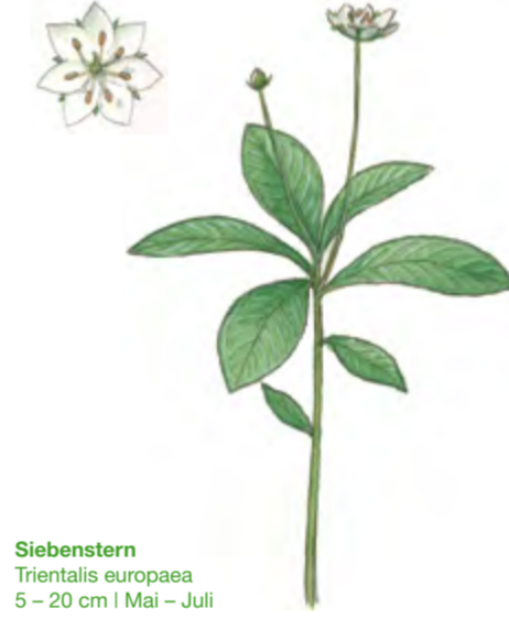
Siebenstern Trientalis europaea 5 – 20 cm | Mai – Juli