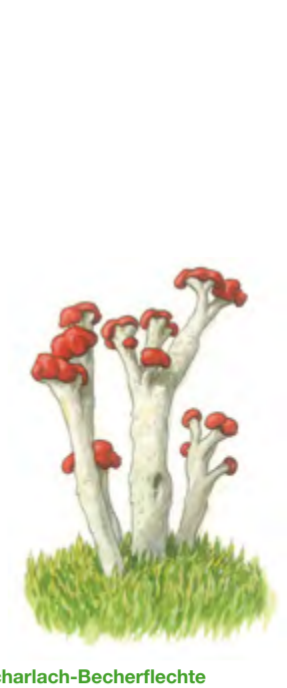
Scharlach-Becherflechte Cladonia coccifera 2 – 4 cm