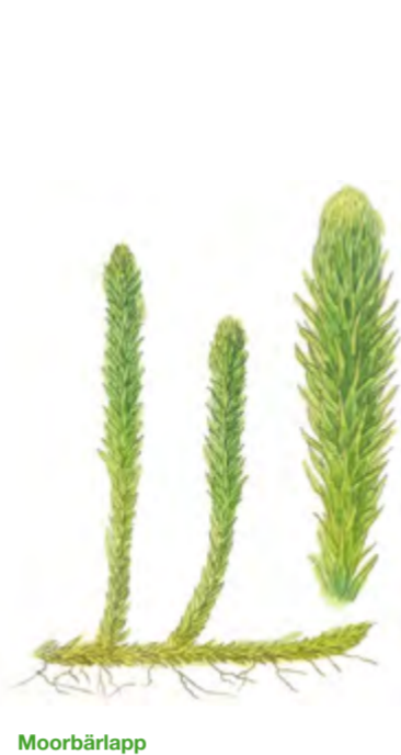
Moorbärlapp Lycopodium inundata 2 – 10 cm | Juni – Oktober (Sporen reifen)