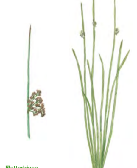
Flatterbinse Juncus effusus 30 – 120 cm | Juni – August