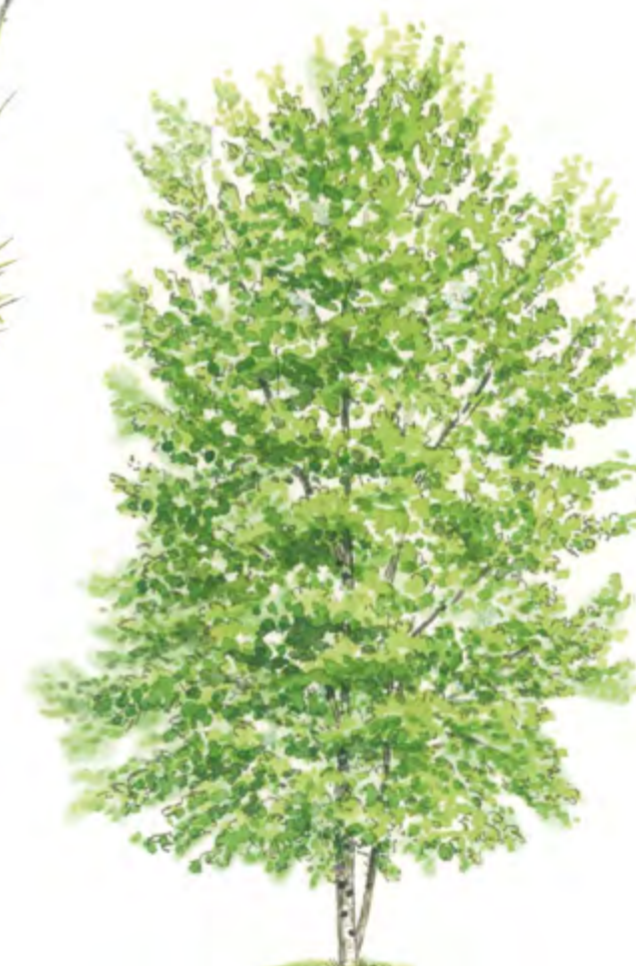
Moorbirke Betula pubescens 5 – 20 m | April – Mai