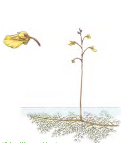
Kleiner Wasserschlauch Utricularia minor 5 – 15 cm | Juni – August