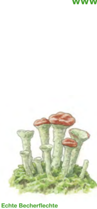
Echte Becherflechte Cladonia pyxidata 1 – 2 cm