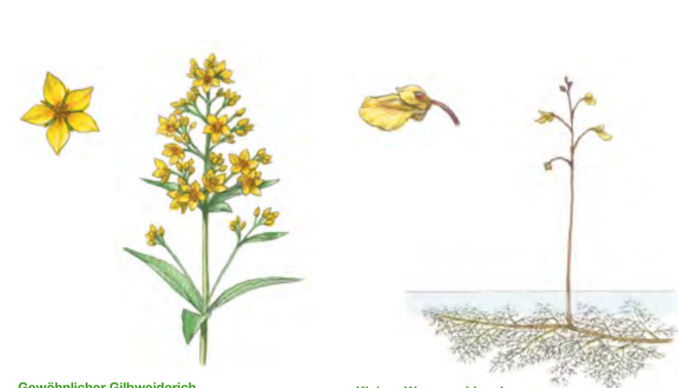
Gewöhnlicher Gilbweiderich Lysimachia vulgaris 50 – 150 cm | Juni – August