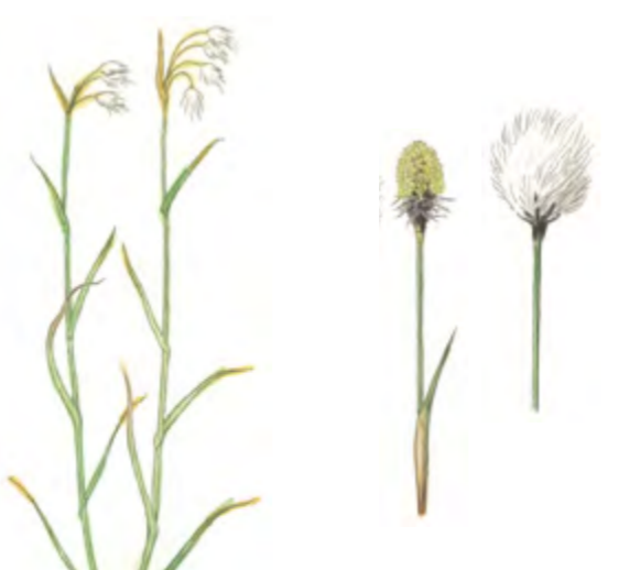
Scheidiges Wollgras Eriophorum vaginatum 50 – 70 cm | März – Mai