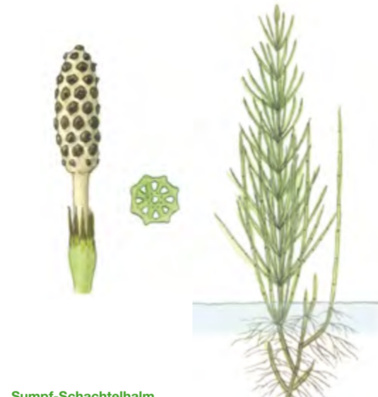
Sumpf-Schachtelhalm Equisetum palustre 10 – 60 cm | Juni – September