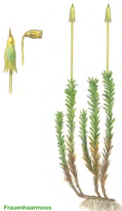
Frauenhaarmoos Polytrichum commune 10 – 40 cm | Juni – August (Sporen reifen)