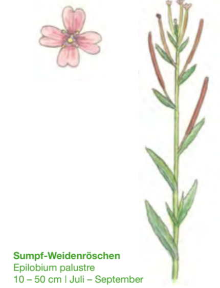
Sumpf-Weidenröschen Epilobium palustre 10 – 50 cm | Juli – September