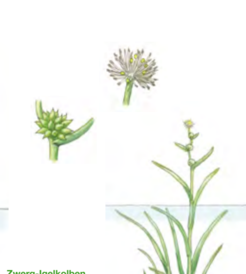
Zwerg-Igelkolben Sparganium natans 10 – 50 cm | Mai – August