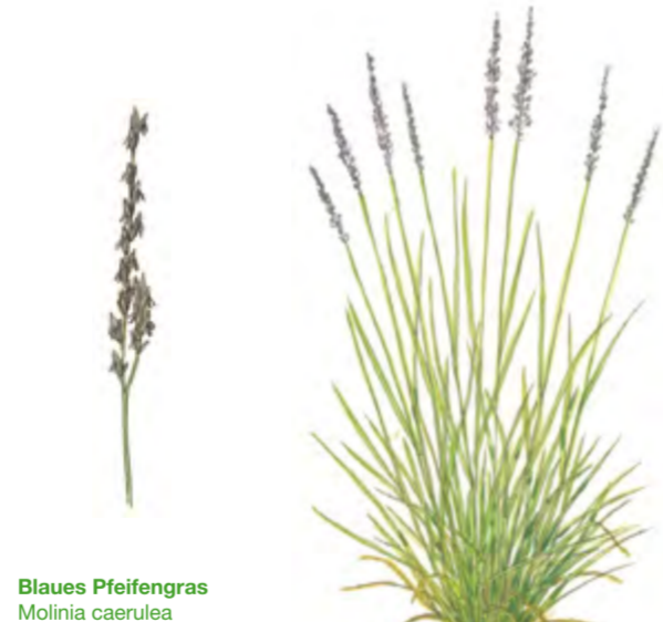
Blaues Pfeifengras Molinia caerulea 30 – 200 cm | Juli – September