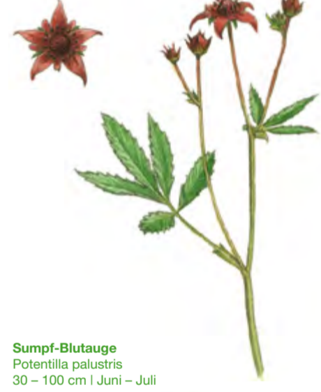
Sumpf-Blutauge Potentilla palustris 30 – 100 cm | Juni – Juli