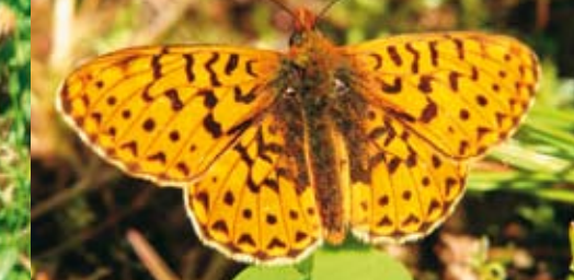
Silberfleck-Perlmutterfalter ⓘ Boloria euphrosyne 36 - 44 mm | Mai - Juli