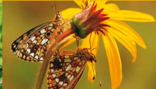
Skabiosen-Schneckenfalter ⓘ ⓘ Euphydryas aurinia (offen + geschlossen)