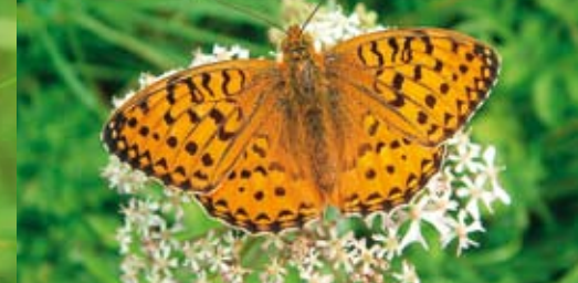
Großer Perlmutterfalter ⓘ Argynnis aglaja 50 - 55 mm | Juni - August