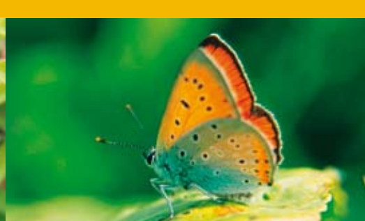
Großer Feuerfalter ⓘ ⓘ Lycaena dispar 27 - 40 mm | Juni - Juli