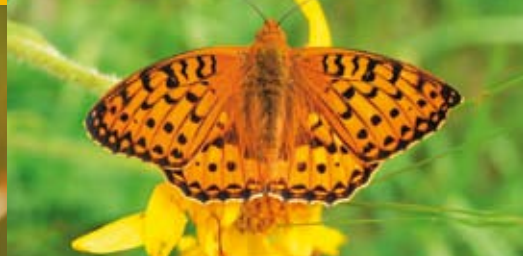
Märzveilchen-Perlmutterfalter ⓘ Argynnis adippe 40 - 45 mm | Juni - September