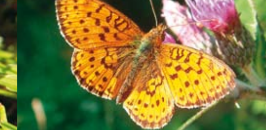
Mädesüß-Perlmutterfalter Brenthis ino 32 - 40 mm | Mai - August