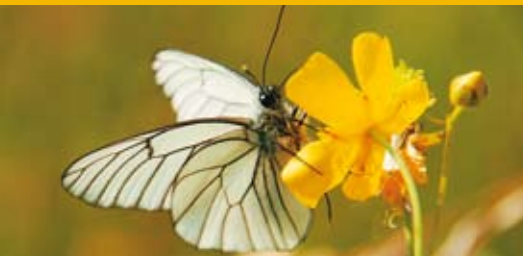
Baumweißling Aporia crataegi 50 - 70 mm | Mai - Juli