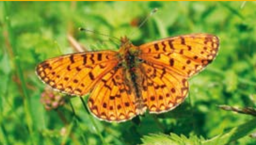
Braunfleckiger Perlmutterfalter ⓘ Boloria selene (offen + geschlossen)