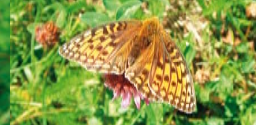
Mittlerer Perlmutterfalter ⓘ Argynnis niobe 40 - 45 mm | Juni - August