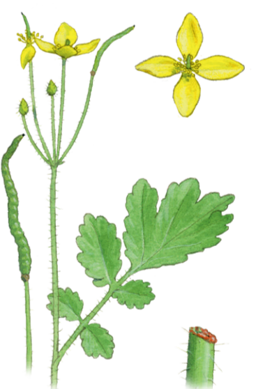
Schöllkraut Chelidonium majus ☀️ Mai–Oktober 📏 30–70 cm