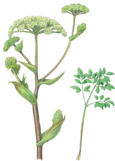
Arznei-Engelwurz Angelica archangelica ☀️ Juli–August 📏 120–300 cm 👉 Heil- und Küchenkraut