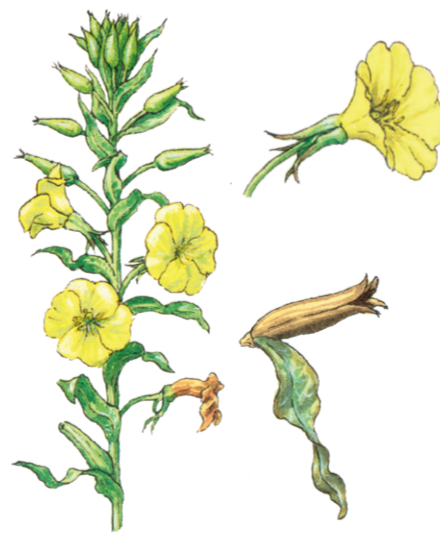
Gewöhnliche Nachtkerze Oenothera biennis ☀️ Juni–September 📏 50–200 cm 👉 Heil- und Küchenkraut