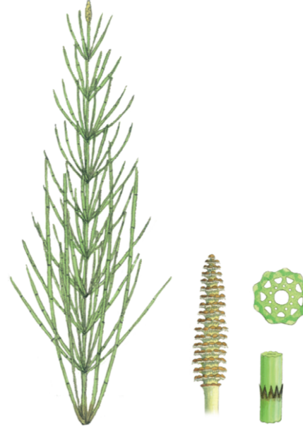
Ackerschachtelhalm Equisetum arvense ☀️ Keine Blüte 📏 10–50 cm 👉 Heil- und Küchenkraut