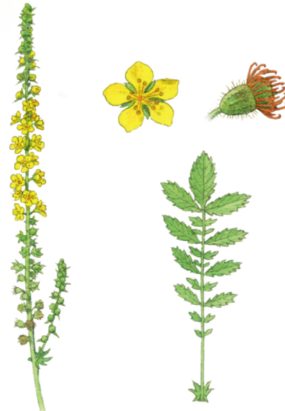
Kleiner Odemennig Agrimonia eupatoria ☀️ Juni–Sept 📏 30–100 cm