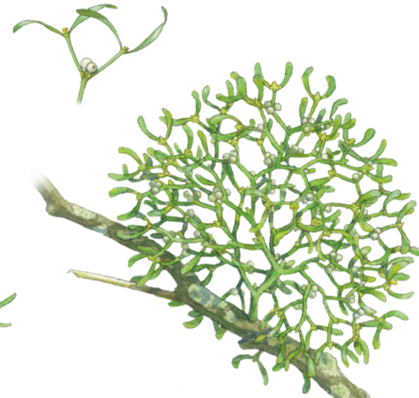
Mistel Viscum album ☀️ Februar–April 📏 20–50 cm