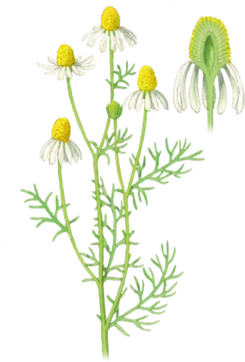
Echte Kamille Matricaria chamomilla ☀️ Mai–August 📏 15–40 cm 👉 Heil- und Küchenkraut