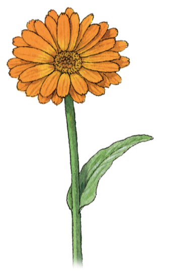
Ringelblume Calendula officinalis ☀️ Juni–Oktober 📏 30–50 cm 👉 Heil- und Küchenkraut