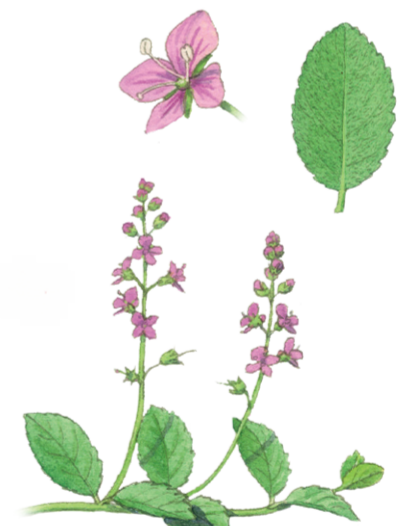
Echter Ehrenpreis Veronica officinalis ☀️ Juni–August 📏 5–20 cm 👉 Heil- und Küchenkraut