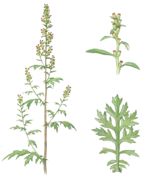
Gewöhnlicher Beifuß Artemisia vulgaris ☀️ Juli–November 📏 60–250 cm 👉 Heil- und Küchenkraut