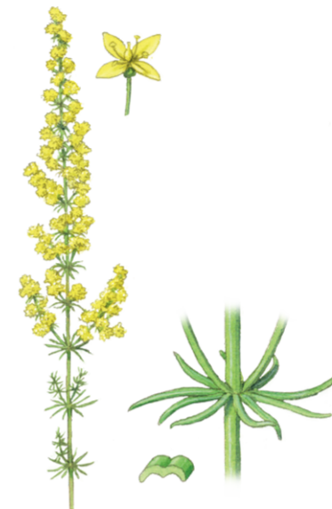
Echtes Labkraut Galium verum ☀️ Juni–September 📏 30–60 cm