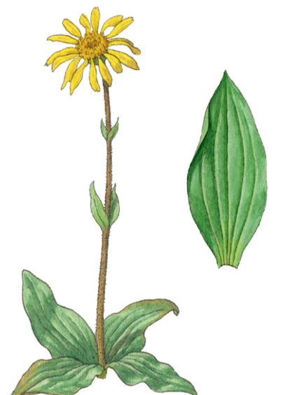
Echte Arnika Arnica montana ☀️ Juni–Juli 📏 20–50 cm

△ Geschützte Arten – Nicht im Freiland sammeln! Samen kaufen und selbst ziehen.