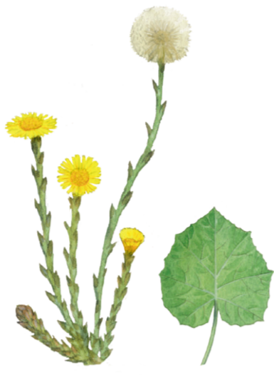
Hufplattich Tussilago farfara ☀️ März–April 📏 7–30 cm 👉 Heil- und Küchenkraut