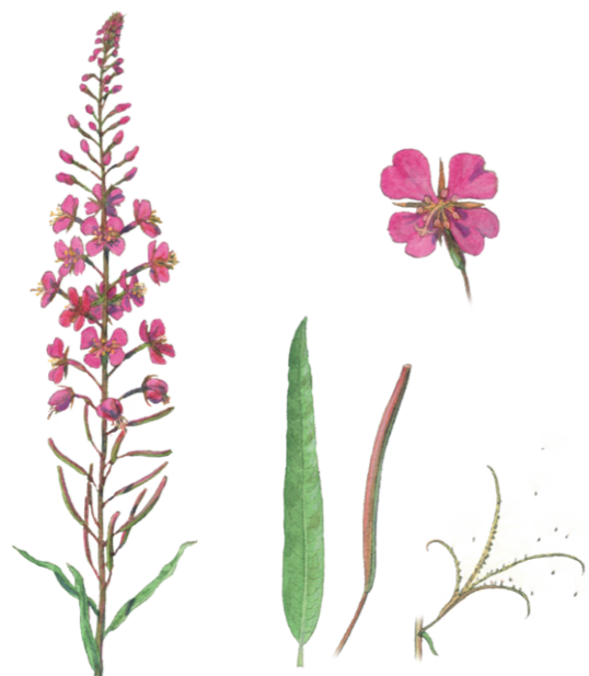
Schmalblättriges Weidenröschen Epilobium angustifolium ☀️ Juli–August 📏 60–120 cm 👉 Heil- und Küchenkraut