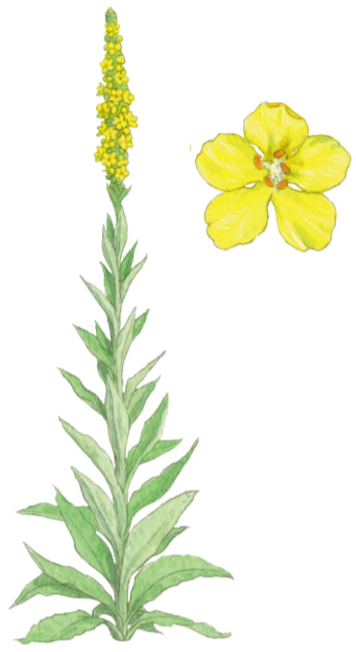
Großblütige Königskerze Verbascum densiflorum ☀️ Juli–September 📏 50–250 cm