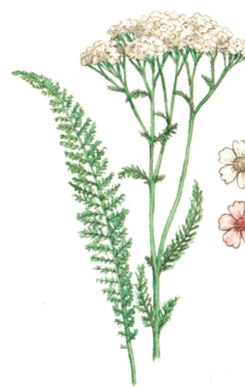
Wiesen-Schafgarbe Achillea millefolium ☀️ Juni–Oktober 📏 20–120 cm 👉 Heil- und Küchenkraut