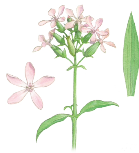
Gewöhnliches Seifenkraut Saponaria officinalis ☀️ Juni–September 📏 30–80 cm