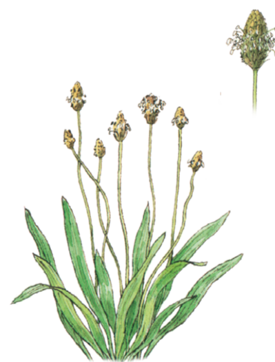
Spitz-Wegerich Plantago lanceolata ☀️ Mai–September 📏 10–50 cm 👉 Heil- und Küchenkraut