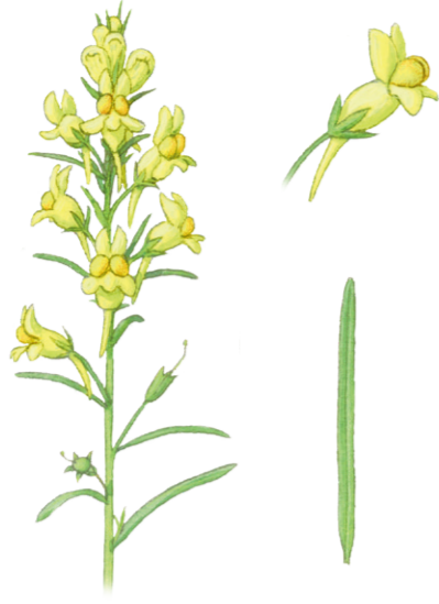
Gewöhnliches Leinkraut Linaria vulgaris ☀️ Juni–Oktober 📏 20–75 cm