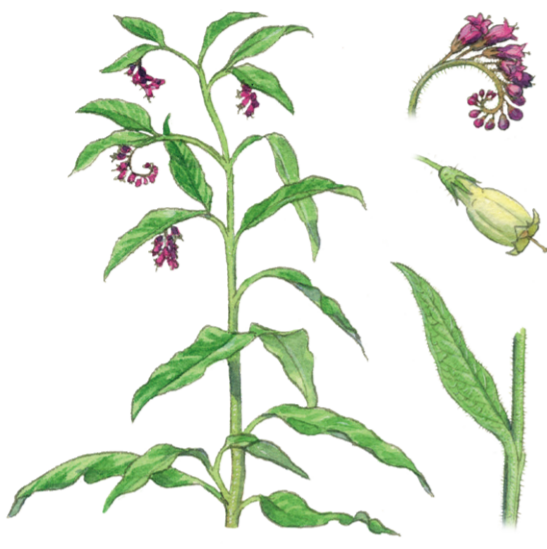
Gewöhnlicher Beinwell Symphytum officinale ☀️ Mai–Juli 📏 30–100 cm