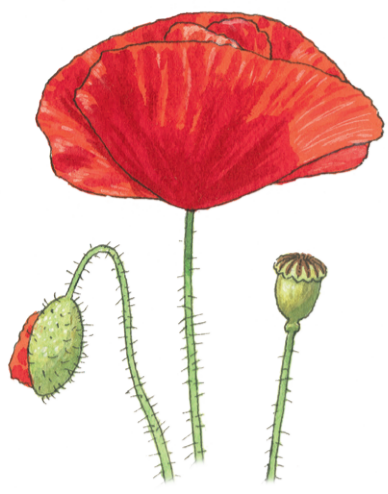
Klatschmohn Papaver rhoeas ☀️ Mai–Juli 📏 30–90 cm 👉 Heil- und Küchenkraut