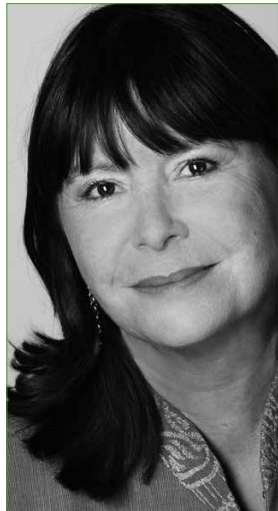
Staatsministerin Ulrike Höfken / Vorsitzende