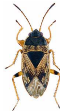
Trapezonotus ullrichi ♂ | ca. 5,7 mm