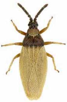
Catoplatys horvathi ♀ | 3,7 – 4,5 mm