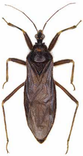
Staubwanze ♀ | 15 – 19 mm Reduvius personatus