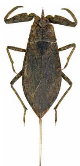
Wasserskorpion ♂ | 17 – 25 mm Nepa cinerea