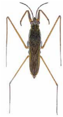
Gemeiner Wasserläufer ♂ | 8 – 10 mm Gerris lacustris