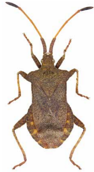
Saumwanze ♂ | 10,5 – 16 mm Coreus marginatus