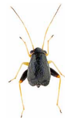
Halticus macrocephalus ♂ | ca. 1,8 mm