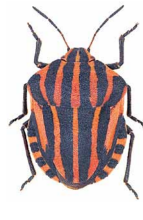
Streifenwanze ♂ | 8 – 12 mm Graphosoma lineatum