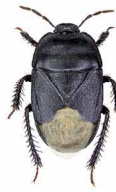
Cydnus aterrimus ♀ | 8 – 11 mm