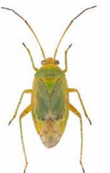
Neolygus zebei ♂ | ca. 5,7 mm