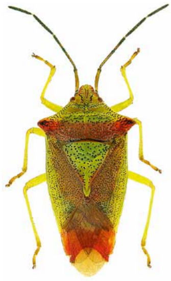
Wipfel-Stachelwanze ♂ | 15 – 17 mm Acanthosoma haemorrhoidale