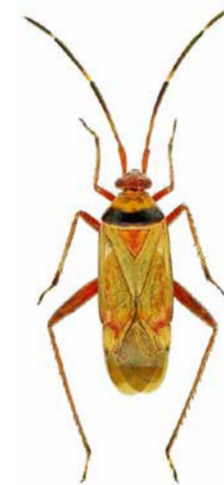
Adelphocoris vandalicus ♂ | ca. 7,6 mm