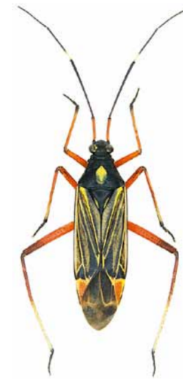
Prachtwanze ♀ | 9,1 – 11,7 mm Miris striatus