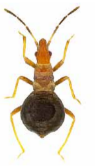
Loricula elegantula ♀ | ca. 1,6 mm