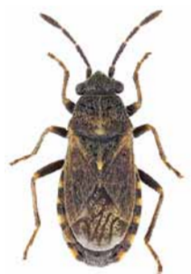
Lygaeosoma sardeum ♀ | ca. 4 mm