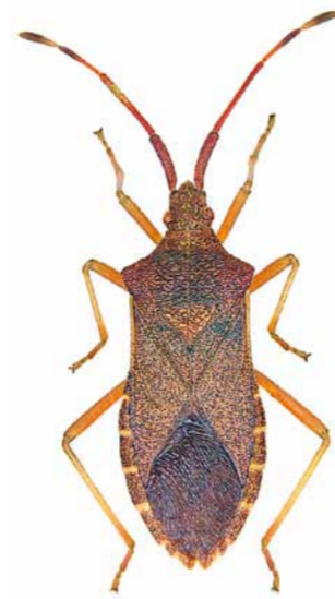
Braune Randwanze ♀ | 12 – 15 mm Gonocerus acuteangulatus