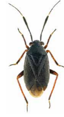
Schwarzrote Weichwanze ♂ | 5,1 – 6,4 mm Capsus ater