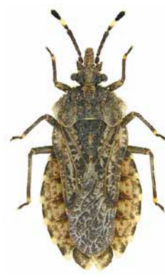
Aradus ribauti ♂ | 7,3 – 9,6 mm