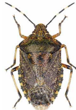
Graue Gartenwanze ♀ | 14 – 16 mm Rhaphigaster nebulosa