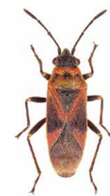
Platanenwanze ♂ | 5,5 – 6,6 mm Arocatus longiceps