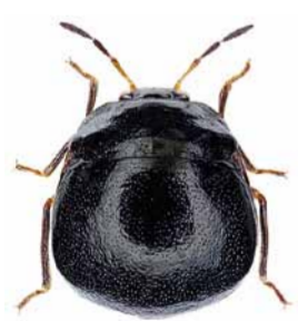
Kugelwanze ♀ | 3,5 – 4,5 mm Coptosoma scutellatum