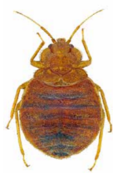
Bettwanze ♀ | 3,8 – 9 mm Cimex lectularius