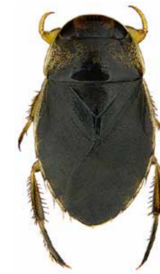
Schwimmwanze ♀ | ca. 13 mm Ilyocoris cimicoides