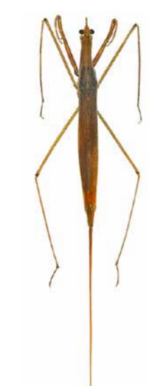
Stabwanze ♀ | 30 – 35 mm Ranatra linearis