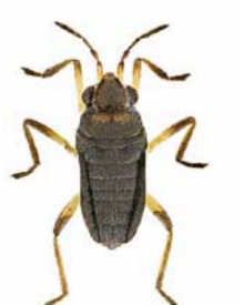
Gemeiner Zwergbachläufer ♂ | ca. 1,4 mm Microvelia reticulata