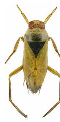
Gem. Rückenschwimmer ♀ | 13,5 – 16 mm Notonecta glauca