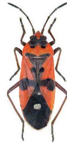
Ritterwanze ♀ | 8 – 14 mm Lygaeus equestris