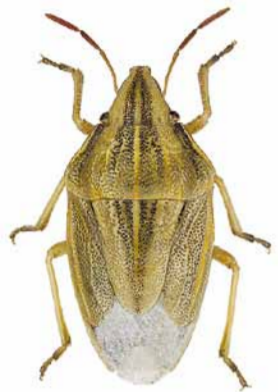
Spitzling ♂ | 8 – 10 mm Aelia acuminata