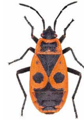
Feuerwanze ♀ | 10 – 12 mm Pyrrhocoris apterus