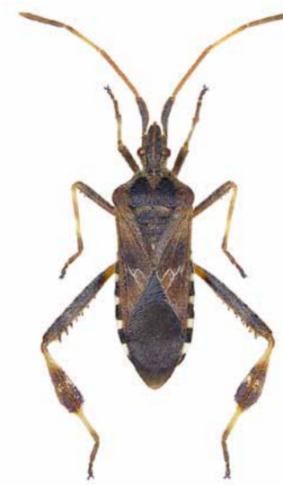
Amerikanische Zapfenwanze ♂ | 16 – 20 mm Leptoglossus occidentalis