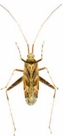
Phytocoris jordani ♂ | ca. 6 mm