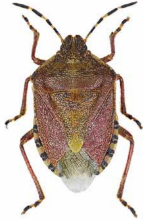
Gemeine Beerenwanze ♂ | 10 – 13 mm Dolycoris baccarum