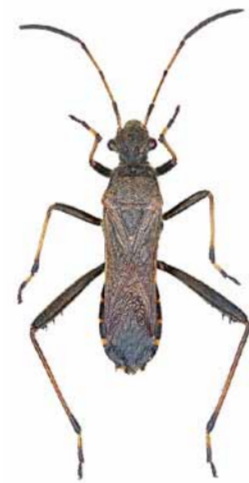
Rotrückiger Irrwisch ♂ | 10 – 12 mm Alydus calcaratus