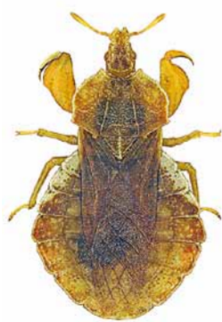
Teufelchen ♂ | ca. 7,7 mm Phymata crassipes