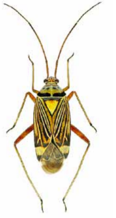
Eichen-Schmuckwanze ♂ | 7 – 8,5 mm Rhabdomiris striatellus