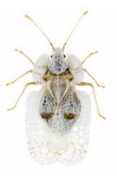
Platanen-Gitterwanze ♀ | 3,3 – 3,7 mm Corythucha ciliata