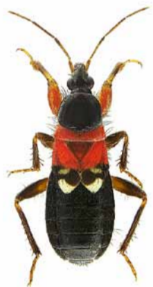
Prostemma sanguineum ♀ | 7,5 – 10 mm