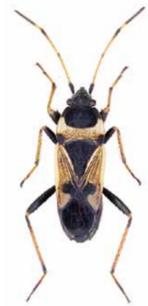
Raglius confusus ♂ | ca. 6,7 mm