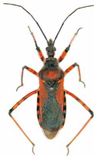
Rote Mordwanze ♂ | 13,8 – 17,6 mm Rhynocoris iracundus