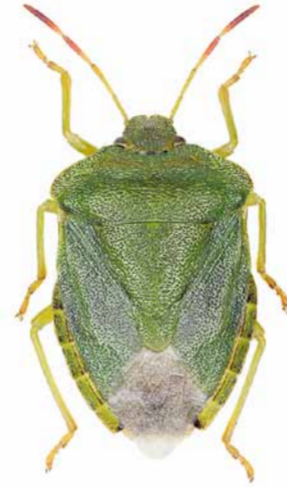
Grüne Stinkwanze ♀ | 12 – 14 mm Palomena prasina