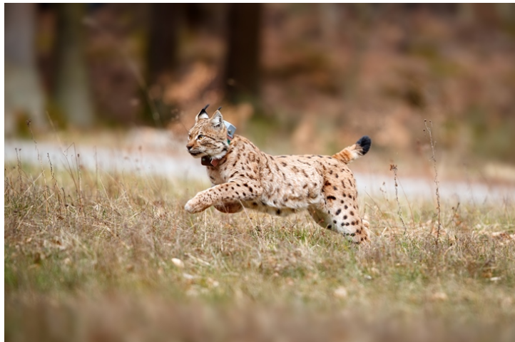
Photo: Lycka lors du lâcher

La photo jointe à ce communiqué est libre pour la presse en indiquant les droits d'auteur: "Cornelia Arens KLICK-Faszination / SNU RLP"