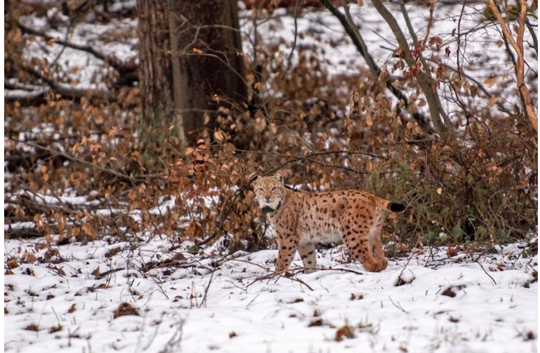
Photo : Lucky, peu de temps après son nouveau lâcher.

La photo de Lucky jointe à ce communiqué est libre pour la presse en indiquant le copyright : © SNU RLP / Annina Prüssing.