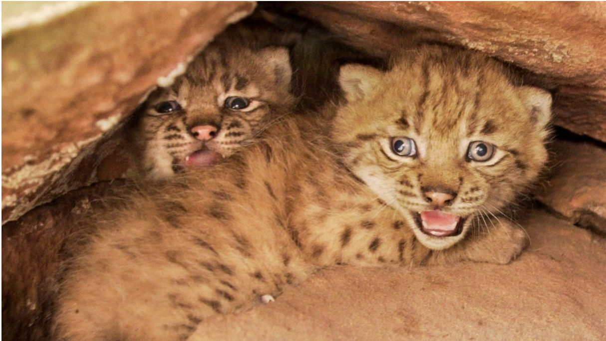
© SNU RLP / Alexander Sommer