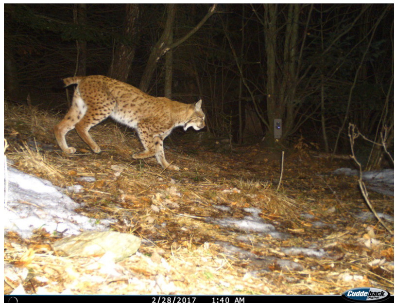
Le lynx Cyril, âgé de 6 ans. Source : DIANA, Slovaquie.

Pour l'auteur, veuillez indiquer : DIANA, Slovaquie.